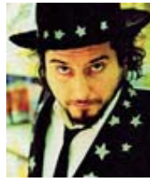
Autore Vinicio Capossela