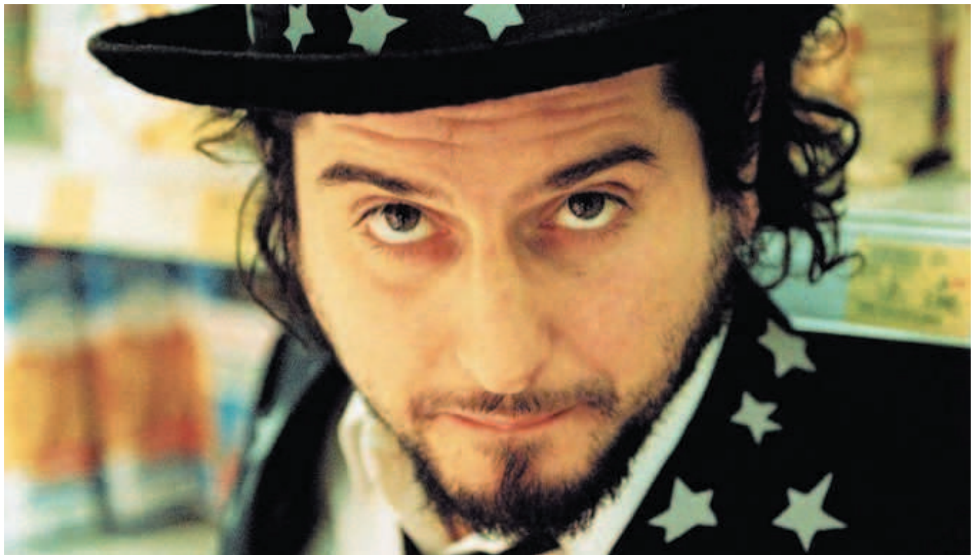
Sul palco: il tour di Capossela in Europa

Il cantastorie in tournée per l'Europa, tappa francese: la letteratura, il mito, il circo. «La scena musicale italiana è come la politica. Ci sono personaggi ingombranti, che occupano spazio rendendo la vita dura agli altri».